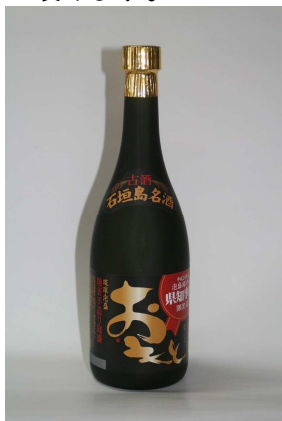
琉球泡盛「おもと」 ※写真はイメージです