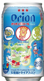
※写真は石垣島大会デザイン缶